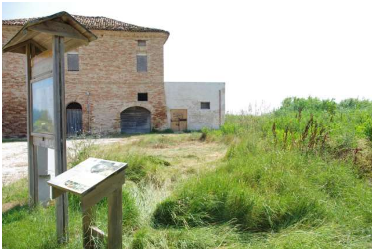
Foto 1 e 2 - Localizzazione del sito dove dovrà essere realizzato il laghetto